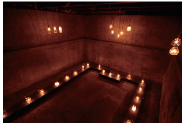
51 【写真】鈴鹿 芳康 / ジョン・アイナーセン / エヴァレット・ブラウン / クー・ボンチャン / トム・シュヴァープ / 浜中 悠樹 / ローズマリン・パランド / 佐伯 【工芸】 中川 麗士 / 面屋 庄甫 / 井上 雅博 / 藤原 昌樹 / 安土 草多 / 生駒 啓子 / 明主 帆 / 平井 秀 室礼~Offerings~Ⅲ | The Terminal KYOTO 【Photography】 Yasu Suzuka / John Einarsen / Shitsurai -Offerings- III | The Terminal KYOTO Everett Brown / Koo Bohncchang / Tomas Svab / Yuki Hamanaka / Roosmarijn Pallandt/Saeki 【Crafts】 Shuji Nakagawa / Shoho Menya / Masahiro Inoue / Masaki Fujiwara / Sota Azuchi / Keiko Ikoma / Wataru Myoshu / Syu Hirai