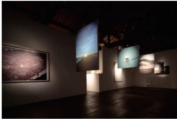
16 牛久保 賢二 Before Folklore | ギャラリーメイン Kenji Ushikubo Before Folklore | galleryMain