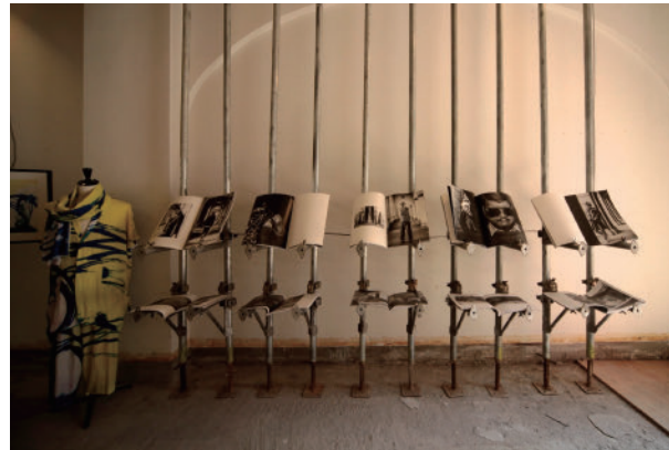
45 PR-y DISTORTION | 元・新風館 PR-y DISTORTION | Former Shinpukan