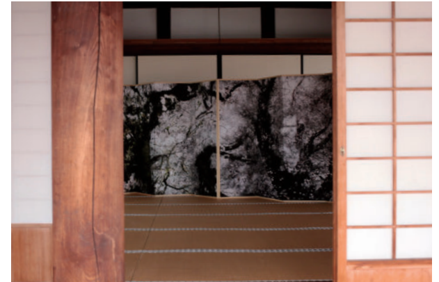
3 キイロ SAKURA | 総本山妙満寺 Kiiro SAKURA | Myomanji Temple