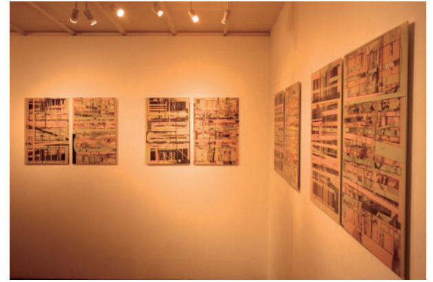
33 岡部 淳史 Digitize | KUNST ARZT Atsushi Okabe Digitize | KUNST ARZT