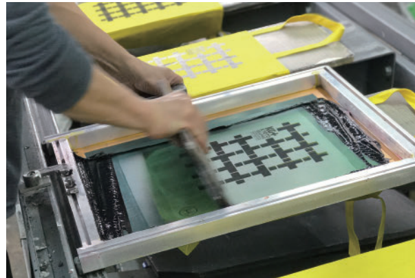
ハイクリエイティブ工房でのトートバッグ製作過程 Tote bag-making process at the HiCREATIVE atelier