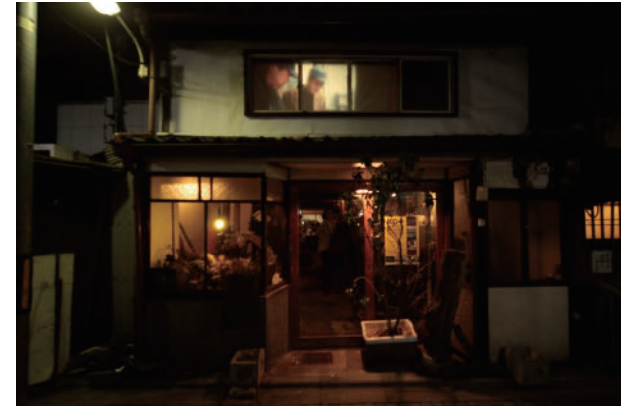
15 小平 篤乃生 Coalscape 石炭のインキ | 食堂ルインズ Atsunobu Kohira Coalscape Ink of Coal | Ruins