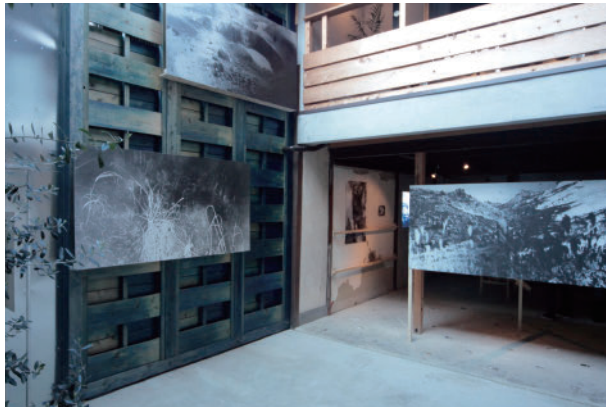
28 守屋 友樹 Still Untitled / A Woman S | Kyoto Art Hostel Kumagusuku Yuki Moriya Still Untitled / A Woman S | Kyoto Art Hostel Kumagusuku