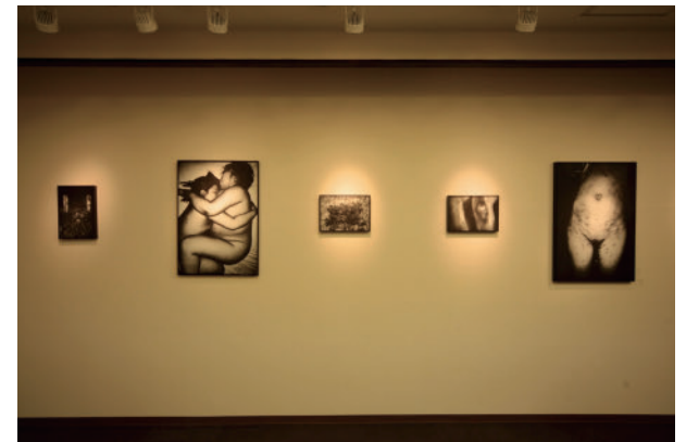
6 ヤマウチ タカモト FROM DUSK in Collotype | 便利堂コロタイプギャラリー Takamoto Yamauchi FROM DUSK in Collotype | Benrido Collotype Gallery