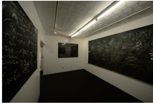
17 西村 勇人 Commons | MATSUO MEGUMI +VOICE GALLERY pfs/w Hayato Nishimura Commons | MATSUO MEGUMI +VOICE GALLERY pfs/w