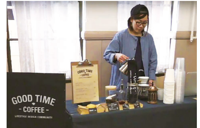
元・淳風小学校 カフェスペース Former Junpu Elementary School cafe space