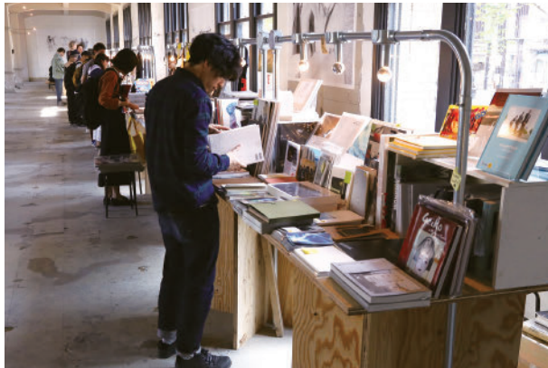
元・新風館 Former Shinpukan

元・淳風小学校、元・新風館など、元々の役割を終えた歴史的建造物を再活用し、展覧会、イベント、ブックフェアの開催、地域の店舗と連携したカフェスペースを設置するなど、情報発信拠点の形成に取り組みました。また、KG + アワード・ファイナリストを中心にKG + 会期半ばで終了した展覧会の中からセレクトした8つの展覧会「KG + 2017 Award Selection」を元・淳風小学校にて開催しました。元・淳風小学校以外で開催していた展覧会については会場を無償提供し、空間に合わせて新たに再構成した展示により、会期を通して良質なコンテンツを発信しました。