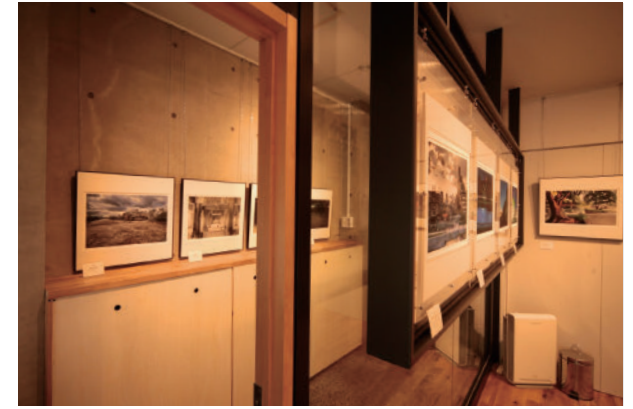
27 笠井 享 洛苑考-鴨川風景 | PS270ギャラリー Akira Kasai Reconfigured Perspectives of the River Walk, Kamogawa, Kyoto | PS270 Gallery