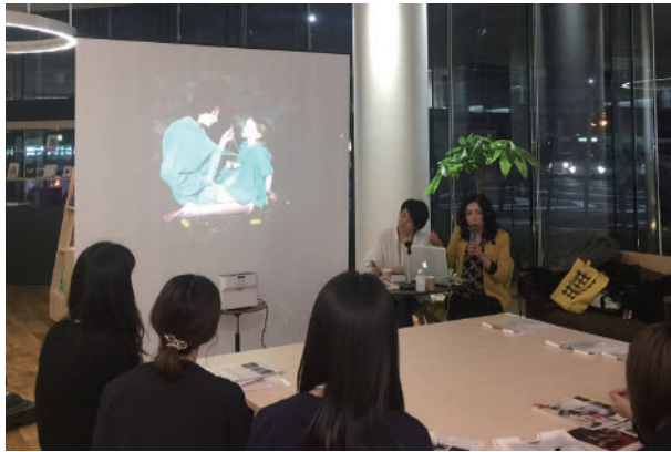
39 ヴィクトリア・ソロチンスキー アーティストトーク | ワコルスタディホール京都 ギャラリー Viktoria Sorochinski Artist talk | WACOAL STUDYHALL KYOTO Gallery