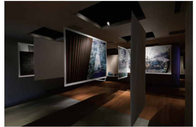
36 八木 夕菜 祈りの空間 | Bijuu Yuna Yagi Space of Prayer | Bijuu