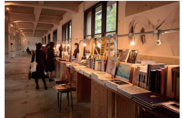
46 写真集展示 | 元・新風館 Photo Book Exhibition | Former Shinpukan