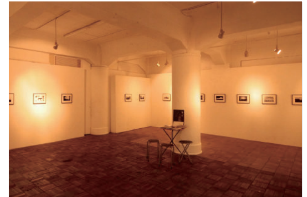
30 齊藤 文彦 憶 | 同時代ギャラリー Bungo Saito longing | DOHJIDAI GALLERY OF ART