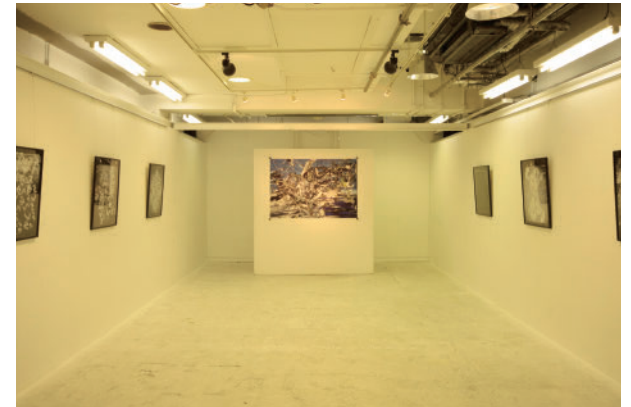
12 ユキナインティスリー New Order | Media shop gallery Yuki93 New Order | Media shop gallery