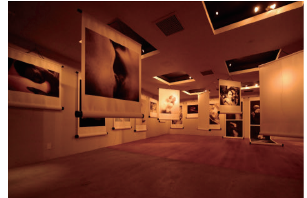
49 ペニンゲン高等芸術学校バリエの学生 Amour | Bijuu Students of Penninghen, Paris school Amour | Bijuu