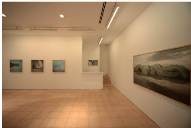
4 이민호 (李致鎭) Fil blanc / Fil rouge | イムラアートギャラリー Minho Lee Fil blanc / Fil rouge | imura art gallery