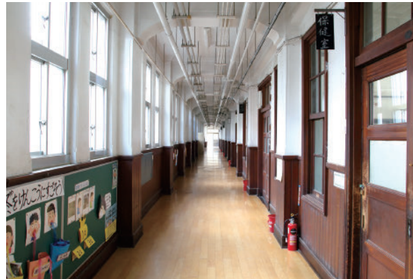
元・淳風小学校 Former Junpu Elementary School