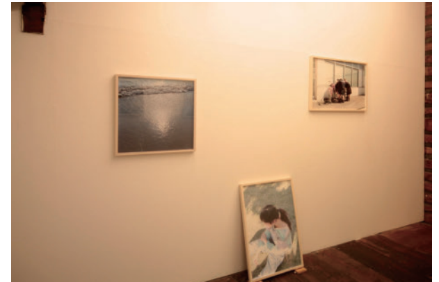
38 ニュージャパン フォト掲載作家 NEW JAPAN PHOTO ISSUE.3 | アンテナメディア LAUNCH SPECIAL EXHIBITION NEW JAPAN PHOTO ARTISTS NEW JAPAN PHOTO ISSUE.3 | Antenna Media LAUNCH SPECIAL EXHIBITION