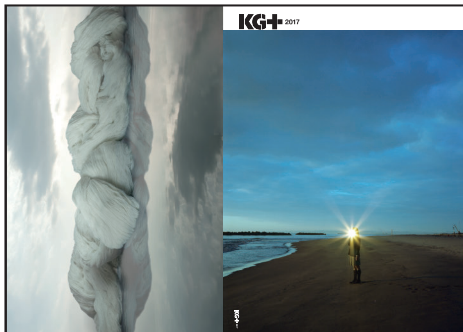
KG+ ブックレット 2017 KG+ Booklet 2017

KG+アワード・アーティストの出展作品及び展覧会コンセプトをバイリンガルで編集したブックレットを2016年に引き続き制作しました。ブックレットはKG+及びKYOTOGRAPHIE各会場で無料配布されました。また、メディアパートナーのSingapore Contemporary（シンガポール）、Asia Contemporary Art Show（香港）、Voies Off（アルル）を始め、国内外の主要な文化施設や国際芸術祭などでも配布し、KG+アワード・アーティストの国際的な情報発信ツールとして活用します。