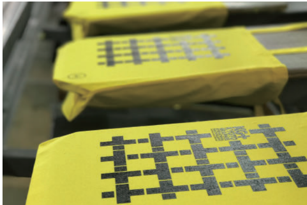
ハイクリエイティブ工房でのトートバッグ製作過程 Tote bag-making process at the HiCREATIVE atelier

パートナー企業の協力により、KG+で初となるグッズ、手拭いとトートバッグを製作しました。手拭いはKG+のプラスを象徴的に組み合わせたモチーフを配し、トートバッグは京都の碁盤の目の街並みをイメージしてデザイン。収益面はもちろん、街中でグッズを身につける人々が行き交うことで広報的效果にもつながりました。