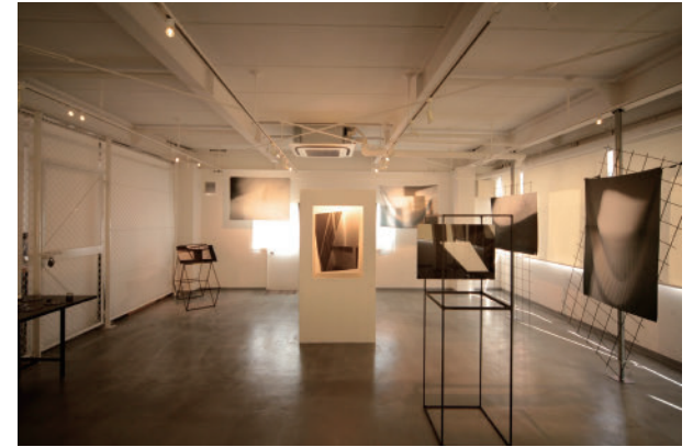
9 堤 麻乃 Into the Void | ル・プチメックOMAKE (3F) Asano Tsutsumi Into the Void | Le Petitmec OMAKE (3F)