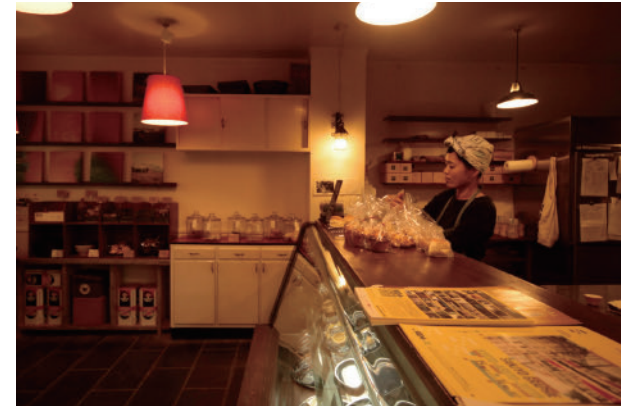
43 三条グラフィー | きょうと、あすと、ずっと。 | 京都三条会商店街 sanjographie | KYOTO-ASUTO-ZUTTO | Sanjo Arcade