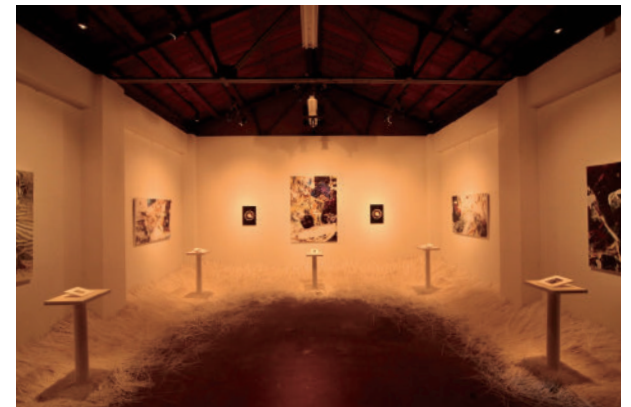
24 ラクア / 山田学 寒光 | trace LAKUA / Manabu Yamada KANKO The Cold Light | trace