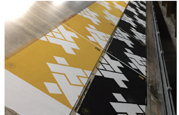
マシュキョウト工房での手拭い製作過程 Tenugui-making process at the mashu Kyoto atelier