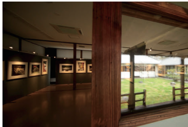
5 クロード・ルフェーヴル The Fuzei in the Japanese Garden | 京都御苑 閑院宮邸跡 レクチャーホール Claude Lefèvre The Fuzei in the Japanese Garden | The Lecture Hall of Kyoto Gyoen, Kan-in-no-miya