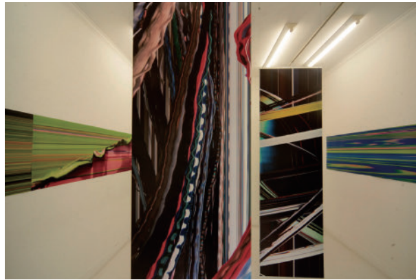
35 トム・シュヴァープ Worldliness for an Old Capital | アートスペース虹 Tomas Svab Worldliness for an Old Capital | Art Space Niji