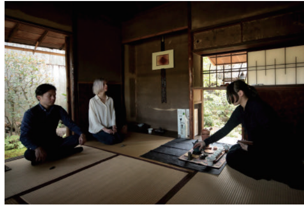
26 荻野 NAO之 写真座談展『A』 | 1部：山笠水明処、2部：鴨川河岸部、 Naoyuki Ogino Photo-Talk-Exhibition "A" | 3部：1部または2部に参加者のみ参加可能イベント開催 | 1) Sanshimeisho 2) Kamogawa Riverside 3) Held at a secret location, open only to Event 1 and 2 participants